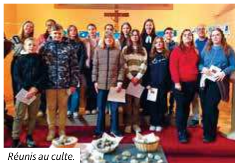
Réunis au culte.