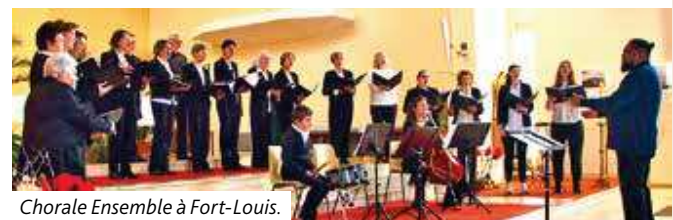
Chorale Ensemble à Fort-Louis.

« Ensemble », pour les deux magnifiques concerts d'hiver à Fort-Louis et à Bischwiller : c'était fort, beau, touchant. Merci au chef de chœur, aux musiciens et aux choristes.