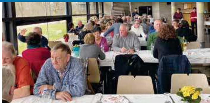
Un grand merci à tous les bénévoles de la paroisse de Lauterbourg-Seltz !