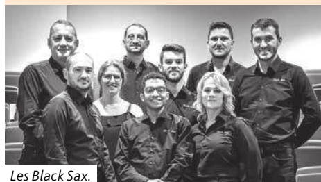
Les Black Sax.