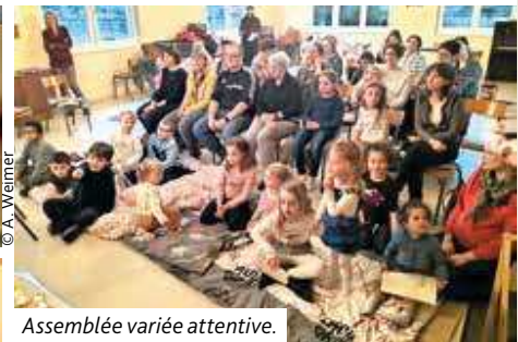
Assemblée variée attentive.

Un culte pour tout petit au foyer de Rountzenheim