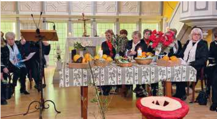
JMP à Betschdorf pour nos communautés catholiques et protestantes.