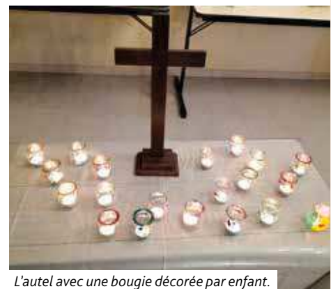
L'autel avec une bougie décorée par enfant.

Un grand merci à la super équipe de préparation et d'animation : Esther Hirrleman, Carmen Eschenbrenner et Castille Aropivia. Cordiale invitation au prochain culte pour tout-petits le 25 mai à 16h30 à l'église de Sessenheim. Pour plus d'info contacter la pasteure Sonnendrücker.