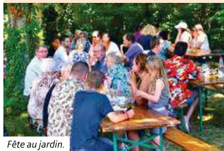
Fête au jardin.

Nous vous invitons à venir nombreux à la 2 ème édition de la Fête d'été : tous au Jardin !