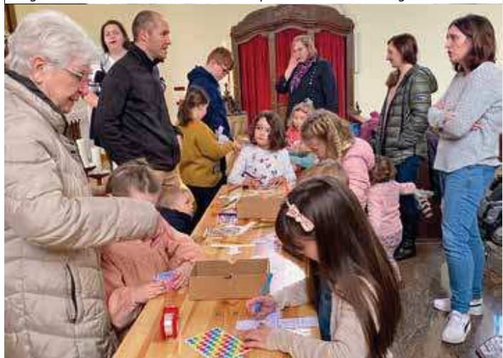
Célébration œcuménique pour petits à Niederroedern « Les Rameaux »