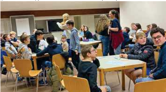
Un petit aperçu de la retraite des confirmands (soirée jeu !).